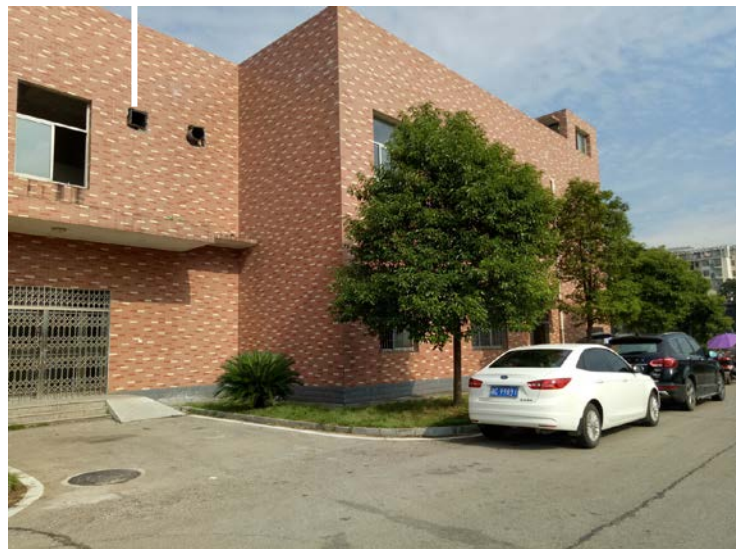
图 2 项目东侧